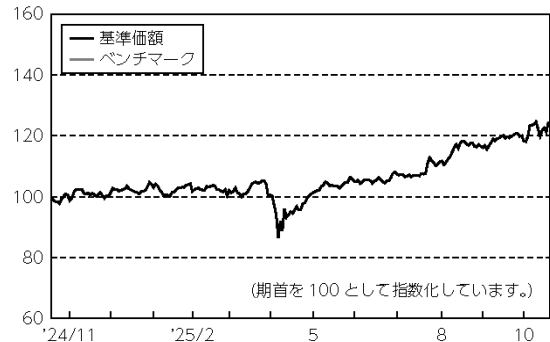
基準価額とベンチマーク（指数化）の推移