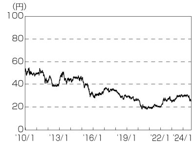
円／ブラジルレアルの推移