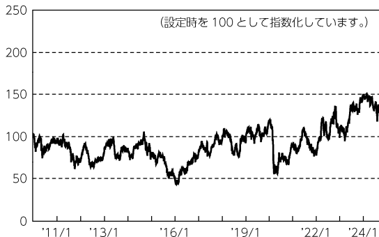
基準価額（指数化）の推移