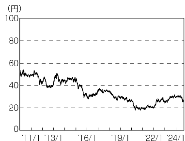
円／ブラジルレアルの推移