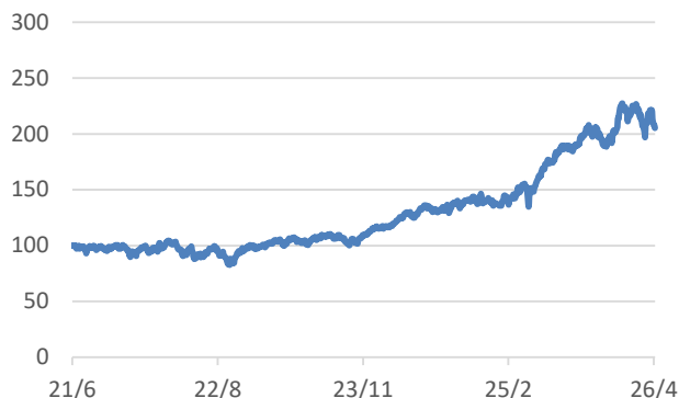
ファクトセット・グローバル・エクステンデッド・スペース・インデックス（配当込み、円ヘッジあり、円ベース）