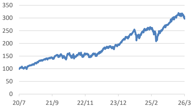
MSCI-WORLDインデックス (税引後配当込み、円ヘッジなし・円ベース)